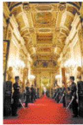
Galerie des Bustes