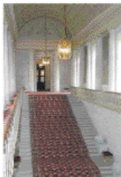
Escalier d'Honneur du Sénat (Construit par Chalgrin entre 1800 et 1803)

Le Palais du Luxembourg abrite une institution : le Sénat. Le Sénat forme avec l'Assemblée nationale le Parlement français. Le Petit Luxembourg est la résidence officielle du Président du Sénat.