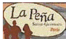
LA PEÑA SAINT GERMAIN 3 passage de la petite Boucherie 75006 PARIS

Tarif de 10 € environ (paiement à l'entrée)