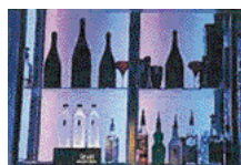
CLUB LES 4 VENTS 18 rue des 4 vents 75006 PARIS